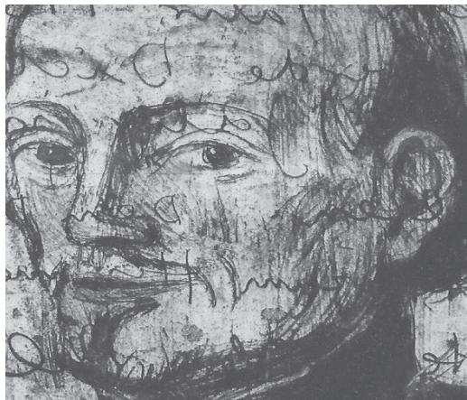
Ulrich Brauchle: Auszug aus dem Philipp Jeningen Bild