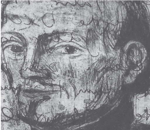
Ulrich Brauchle: Auszug aus dem Philipp Jeningen Bild